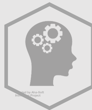
Desenvolvimento do EPR assente em inovação e conhecimento